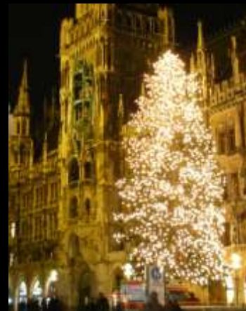
Árbol navideño en Munich