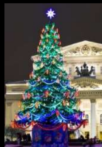
Navidad en Zurich