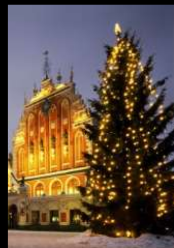
El abeto en Letonia