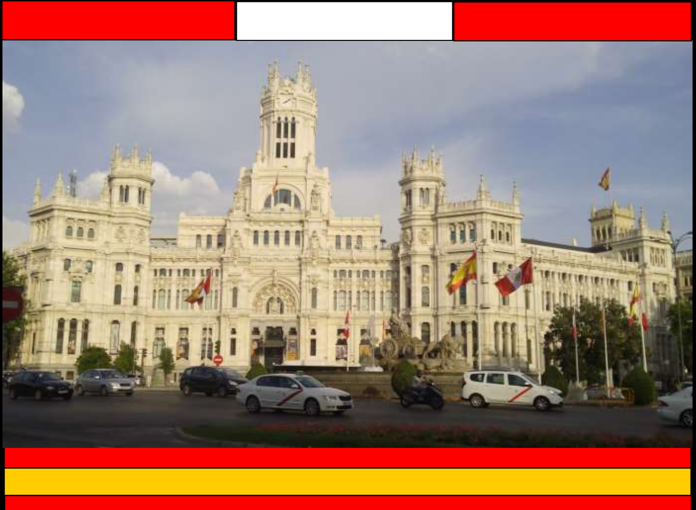
Fotografía de la bandera de Perú flameando en la Plaza de Cibeles de Madrid. La enseña nacional ondea en la plaza principal de la capital de España cuando se trata de una visita oficial del Presidente de la Nación. En el fondo, el Ayuntamiento de Madrid.