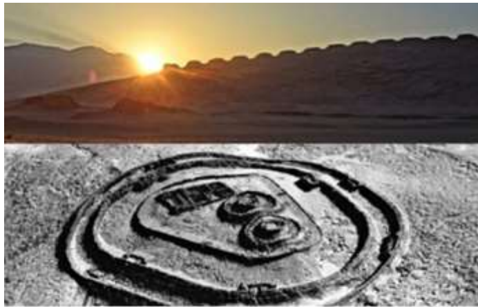
Observando el Sol desde uno de los observatorios más antiguos que se conocen: Chankillo, Lima, Perú, “amarrando” en cada torre, en el horizonte, una fecha. Construido por el hombre andino.

vestimenta se aligera y el ánimo luego de la “sangre alterada de la primavera”, toma un cariz más festivo ya que el calor lo propicia, ha llegado la hora de la cosecha, es decir de recoger lo sembrado anteriormente, si no lo hemos olvidado, ya que cada estación coincide con una tarea agrícola, aún ahora en la era industrial-robótica, pues ella también tiene “sus tiempos”, aunque generalmente se les llaman