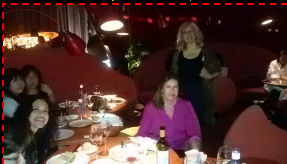
Protagonistas del libro disfrutando de una bonita velada.