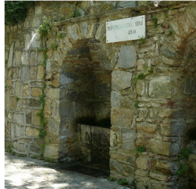
Entorno de la casa